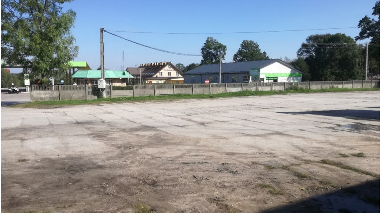
Obecny stan placu

Obecnie plac nie wykorzystany - pustostan. Jedynie raz na tydzień, w czwartki w niewielkiej części placu odbywają się targi. W okresie zimowym Gmina pod wiatą przechowuje piasek do odśnieżania dróg.